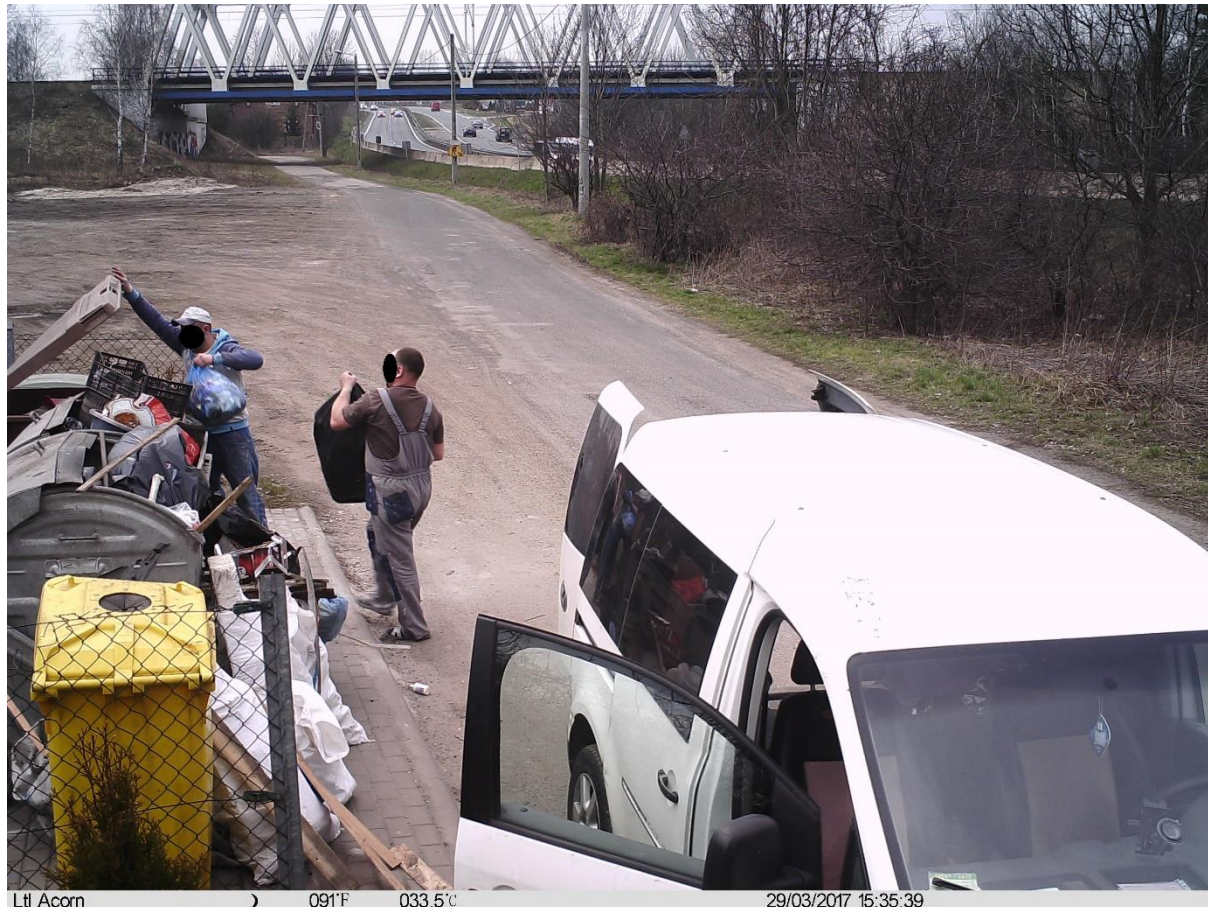
Foto. 3. Przykładowe zdjęcie wykonane przez fotopułapkę, dokumentujące fakt nielegalnego deponowania odpadów

W celu ograniczenia, a docelowo wyeliminowania, procederu podrzucania odpadów na teren Sławkowa przez mieszkańców i przedsiębiorców z terenu gmin ościennych, jak w celu walki z dzikimi wysypiskami odpadów, podjęto decyzję o zakupie fotopułapek. Fotopułapki zostały zakupione w ramach środków stanowiących tzw. fundusz środowiskowy (środki z opłat i kar za korzystanie ze środowiska). Monitoringiem wizyjnym objęto w pierwszej kolejności wybrane, problemowe, stanowiska kontenerowe, w obręb których podrzucana jest największa ilość odpadów, w tym odpadów, które deponowane są w ich obrębie niezgodnie z prawem (głównie stanowisk kontenerowych w ciągu ulic Wrocławska – Piłsudzkiego – Olkuska, ponadto w rejonie ulicy Walcownia, Fabryczna, Kolejowa). Już w pierwszych miesiącach funkcjonowania ujawniono liczne przypadki nielegalnego podrzucania odpadów, kierując odpowiednie wnioski do sądu lub prowadząc postępowania mandatowe.