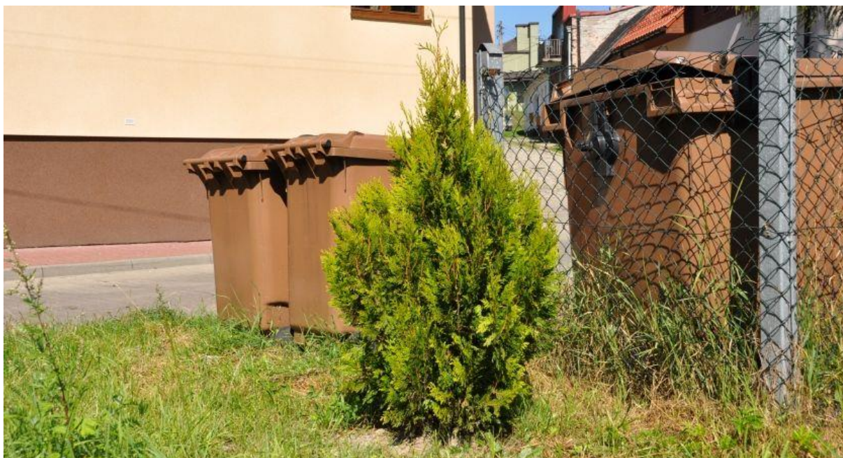
Foto. 3. Obsadzone zielenią stanowisko kontenerowe przy ulicy Browarnej

W toku prowadzonego monitoringu odpadowego stwierdzono, że duża część pojemników na odpady jest w bardzo złym stanie technicznym. Dokonano zakupu i wymiany kilkudziesięciu pojemników do selektywnej zbiórki odpadów.