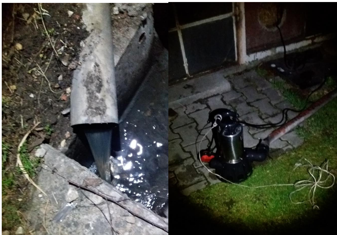
Foto. 2. Przykładowa kontrola opróżniania zbiorników na nieczystości ciekłe – nocny zrzut ścieków ul. Hrubieszowska

W latach 2016 – 2017 przeprowadzono działania z zakresu budowy/remontów sieci wodociągowych, w tym w ul. Piekarskiej – sieć \varnothing 110 mm PE SDR 11 – wraz z przyłączami została wykonana w ramach zadania „Kompleksowa przebudowa ulic: Mały Rynek, Kościelna, Biskupia, Piekarska, Staropocztowa w Sławkowie”. Sieć \varnothing 150 mm, hydranty p.poż – szt.1, 5 przyłączy wodociągowych oraz utwardzenie podłoża po wykopie. Wykonawcą robót był Miejski Zakład Wodociągów i Kanalizacji w Sławkowie.