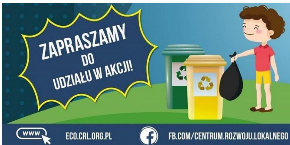
Ryc. 12. Kampania edukacyjna o zasadach segregacji odpadów

W 2019 roku Miasto Sławków znalazło się w gronie partnerów ogólnopolskiej, proekologicznej kampanii edukacyjnej, której głównym celem było zachęcanie dzieci do segregowania odpadów. Organizatorem akcji było Centrum Rozwoju Lokalnego z Zawiercia, a adresatami – przedszkola i szkoły podstawowe. Przedszkolaki i dzieci z klas I – III miały za zadanie w odpowiedni sposób pokolorować kosze, a następnie przyporządkować im odpady podlegające segregacji. Po wykonaniu zadania rysunki z pojemnikami w odpowiednich kolorach trafiły do domów dzieci, przypominając domownikom o zasadach prawidłowej selekcji odpadów.