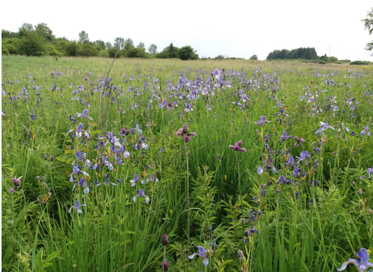
Ryc. 18. Obszar Natura 2000 Łąki w Sławkowie – stanowisko kosańca syberyjskiego

W 2018 staraniem Koła Wędkarskiego uruchomiona została „Szkółka wędkarska”. Realizacja pomysłu stała się możliwa dzięki wsparciu finansowemu urzędu miasta w Sławkowie, który w ramach złożonej przez wędkarzy oferty na realizację zadania publicznego przekazał na ten cel 4 tys. zł. Szkółka ma być interesującą alternatywą dla spędzania przez najmłodszych czasu w domu, przed komputerem. W szkółce pod opieką wędkarzy dzieci i młodzież mogą dowiedzieć się jak najwięcej o faunie stawu i przepływającej obok Białej Przemszy. Jej rolą jest rozbudzenie w dzieciach i młodzieży potrzeby kontaktu z przyrodą, szacunku do niej, a także ma pozwolić na uczestnictwo najmłodszych w działaniach mających na celu ochronę przyrody i zapobieganie dewastacji środowiska. Na specjalnych planszach przy altanie przedstawione zostały gatunki ryb zamieszkujące staw i Białą Przemszę wraz z krótkimi opisami.