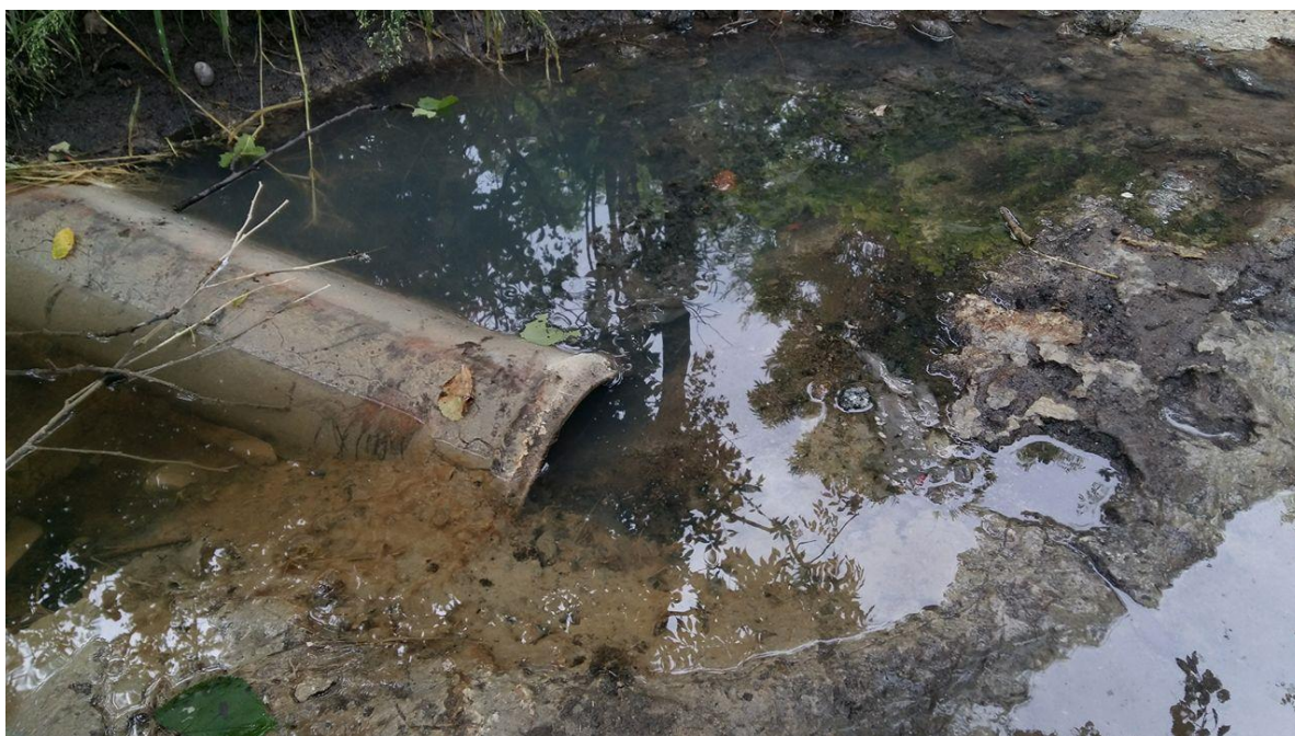
Ryc. 5. Kontrole szamb – nielegalny zrzut Owocowa

związane ze skargami i wnioskami mieszkańców. Niestety zdecydowana większość kontroli potwierdza nieprawidłowości w zakresie opróżniania zbiorników na nieczystości ciekłe, przy czym bardzo duża część związana jest z zanieczyszczeniem środowiska wodno-gruntowego poprzez nielegalne zrzuty ścieków. Największym problemem są nieszczelne szamba w rejonie ulicy Hrubieszowskiej i Krakowskiej, z których poprzez system rowów przydrożnych i odwadniających zanieczyszczenia dostają się do Sławkowskiej Strugi, a dalej do Białej Przemszy. W 2018 roku przeprowadzono kompleksową kontrolę ulicy Owocowej, podczas której prawie 80% skontrolowanych nieruchomości w sposób rażąco niezgodny z prawem pozbywało się ścieków. W 2019 roku przeprowadzono 29 kontroli, również większość stwierdziła nieprawidłowości.