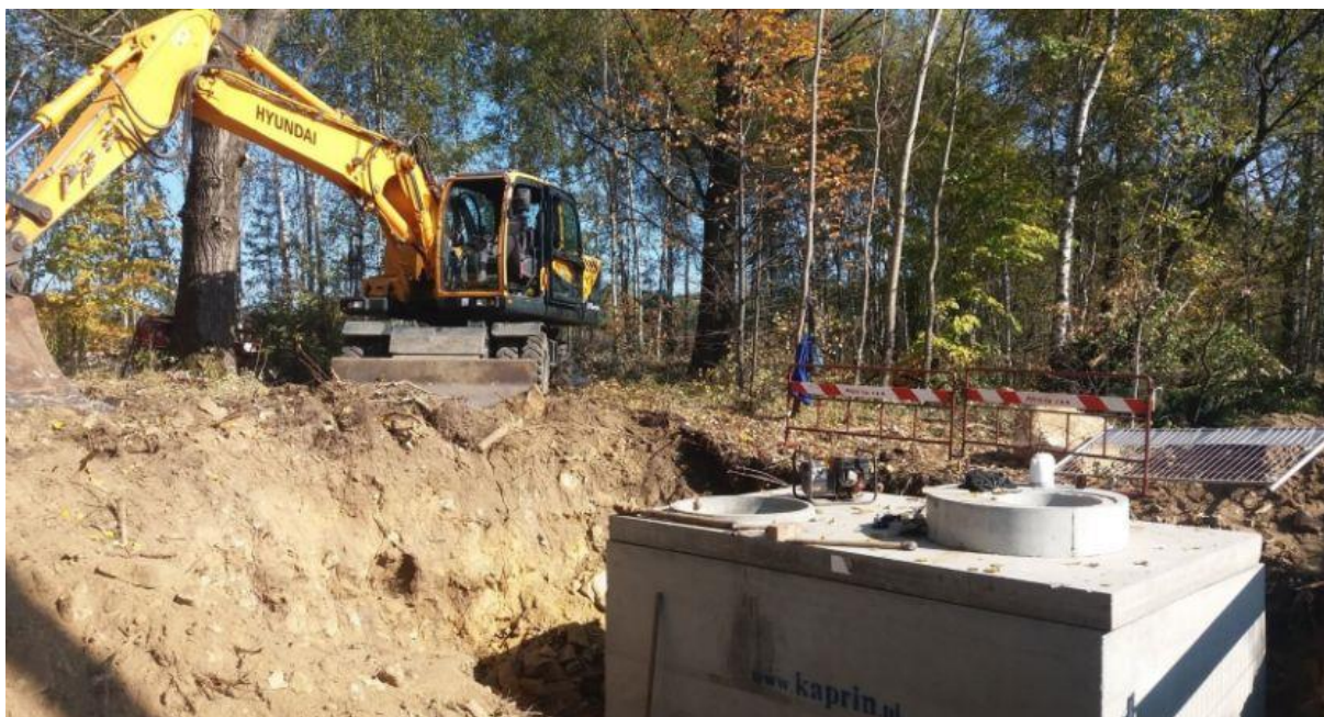
Ryc. 3. Komora połączeniowa sieci wodociągowych Sławkowa i PWiK Olkusz

W latach 2018 - 2019 roku kontynuowano rozpoczęte w 2017 roku działania zmierzające do wyznaczenia strefy ochrony pośredniej dla ujęcia wody, mające na celu wytyczenie granic wokół ujęcia, w których zgodnie z zapisami prawa wodnego, ograniczone lub zabronione może być prowadzenie prac mogących spowodować zmniejszenie przydatności ujmowanej wody lub wydajności ujęcia, między innymi stosowanie nawozów i środków ochrony roślin czy wykonywanie robót melioracyjnych i wykopów ziemnych. W 2018 roku opracowany został dokument pn. Analiza ryzyka dla ujęcia wód w Sławkowie. Działanie jest tożsame z działaniem określonym w obszarze interwencji – gospodarowanie wodami.