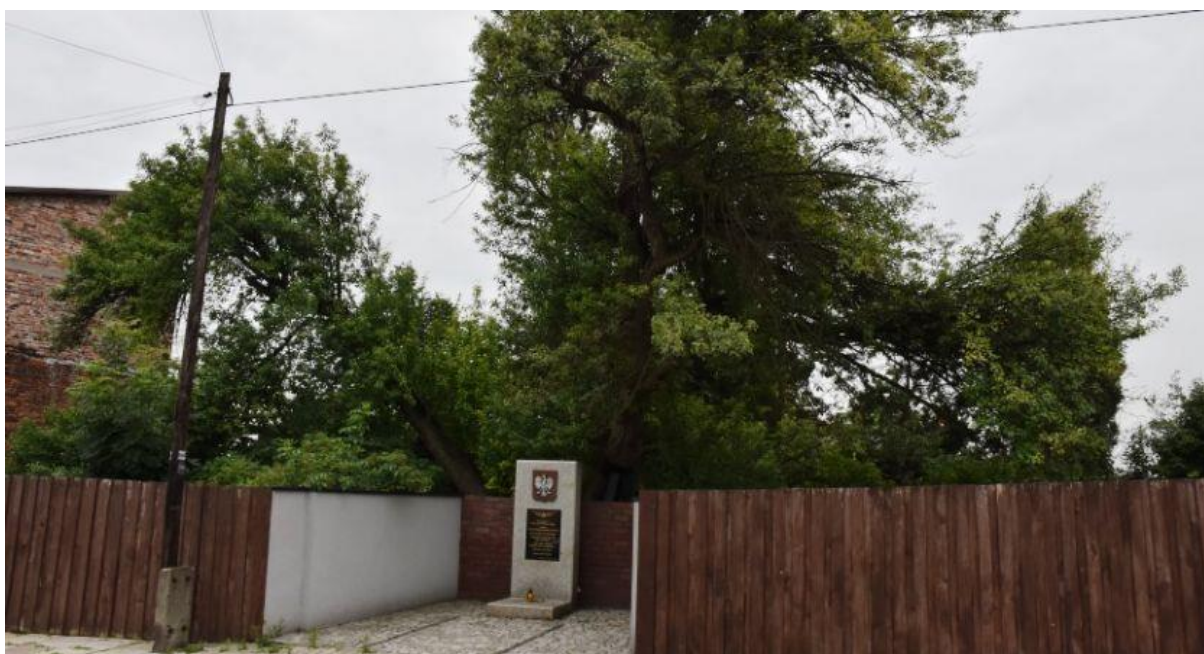
Ryc. 17. Pomnik przyrody przy ulicy Krzywda

Jednym z najważniejszych działań w zakresie ochrony zasobów przyrodniczych było opracowanie Planu Zadań Ochronnych dla obszaru Natura 2000 Łąki w Sławkowie. Dokument został zatwierdzony Zarządzeniem Regionalnego Dyrektora Ochrony Środowiska w Katowicach w dniu 22 listopada 2019 roku. W ramach opracowywanego przez Regionalną Dyрекcję Ochrony Środowiska dokumentu odbyła się seria spotkań konsultacyjnych dotyczących opracowania planu zadań. Przedstawiciele gminy, środowisk naukowych oraz organizacji pozarządowych włączyli się w opracowywanie dokumentu, deklarując chęć współpracy z ekspertami, mającymi przygotować dokumentację niezbędną do opracowania planu zadań ochronnych, tworząc tzw. Zespół Lokalnej Współpracy. Prace nad planem zadań ochronnych realizowane były w ramach ogólnopolskiego projektu „Opracowanie planów zadań ochronnych dla obszarów Natura 2000” nr POIS.02.04.00-00-0193/16, prowadzonego