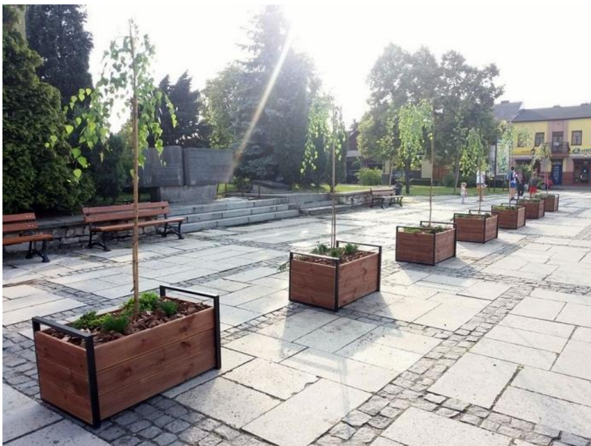
Ryc. 15. Donice z wprowadzonymi nasadzeniami zieleni

Warto wspomnieć, że od stycznia 2019 roku w Sławkowie działa zespół do spraw zieleni, który zajmuje się pielęgnacją i utrzymaniem zieleni na terenach miejskich, a także utrzymaniem czystości i porządku. Dzięki temu udało się znacznie usprawnić prace związane z zielenią, a tym samym poprawić estetykę Sławkowa. Dla przykładu: park miejski, który dotychczas był koszony 2-3 razy w roku, w tym był koszony już 6 razy! Podobnie z plantami w Rynku, terenami przy placach zabaw czy na skwerach.