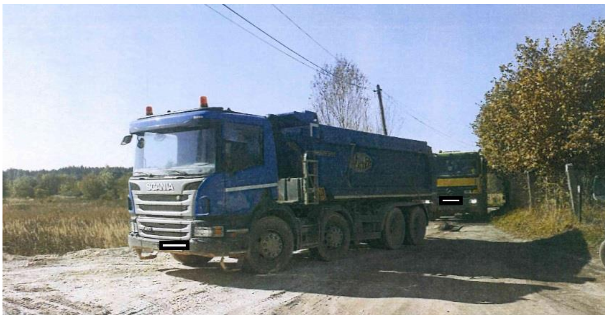
Ryc. 9. Zatrzymany transport zanieczyszczonej ziemi

Urząd miasta w okresie wiosenno – letnim, w dużej mierze ze względu na suszę, wprowadzał rozwiązania mające na celu ochronę wierzchniej warstwy gleby i zasiedlających ją organizmów związane z ograniczaniem koszenia trawników na terenach zarządzanych przez miasto. Wyższa trawa lepiej utrzymuje wilgoć i zapobiega erozji ziemi przeciwdziałając jej przesuszaniu się.