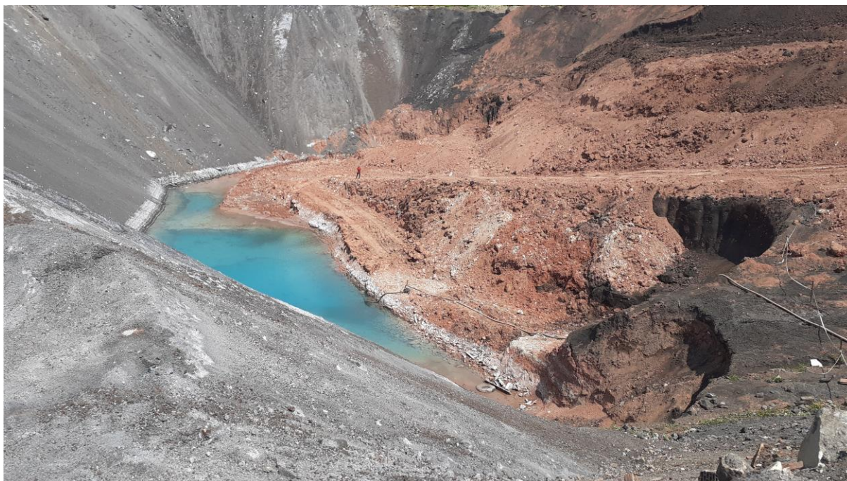
Ryc. 8. Cegielnia Sławków – wyrobisko z widocznym obszarem eksploatacji i rekultywacji

Działania urzędu ukierunkowane na ochronę zasobów geologicznych dotyczyły także opiniowania koncesji na wydobycie kopalin ze złóż surowców, które swoim zasięgiem obejmują także Gminę Sławków, czy opiniowania projektów robót geologicznych, czy planów ruchu likwidowanych zakładów górniczych. W okresie sprawozdawczym pozytywnie zaopiniowano projekt decyzji Marszałka Województwa Małopolskiego udzielającej koncesji na wydobycie piasków formierskich z części złoża Szczakowa w granicach obszaru górniczego „Bukowno I”, jak i zaopiniowano pozytywnie Plan Ruchu Likwidowanego Odkrywkowego Zakładu Górniczego Kopalnia Piasku”Szczakowa”.