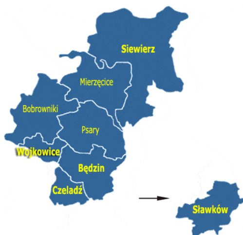
Rysunek 1. Położenie Sławkowa na mapie powiatu będzińskiego.

Miasto Sławków położone jest w województwie śląskim, w powiecie będzińskim, na prawym brzegu Białej Przemszy. Sławków w obrębie województwa śląskiego graniczy z powiatowymi miastami takimi jak: Dąbrowa Górnicza, Sosnowiec oraz Jaworzno, natomiast w obrębie województwa małopolskiego graniczy z gminą miejską Bukowno oraz gminą wiejską Bolesław.