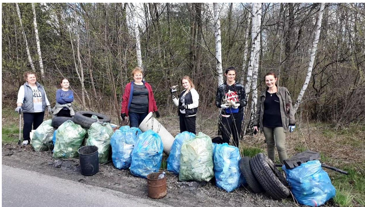
Rysunek 6. VI Sławkowski Dzień Ziemi – #trashtagslawkow2021