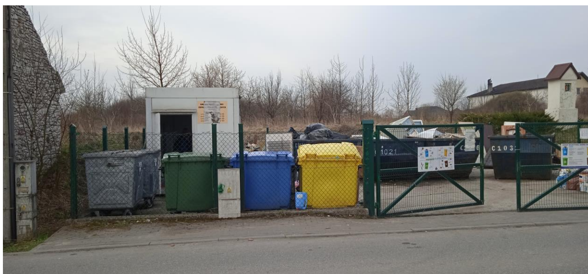
Rysunek. 4. GPSZOK Sławków

Gminny Punkt Selektywnej Zbiórki Odpadów Komunalnych jest prowadzony przez gminę, co znalazło odzwierciedlenie w prowadzonej ewidencji odpadów. Natomiast usługę odbioru i zagospodarowania odpadów z GPSZOK świadczy na rzecz gminy firma wybrana w przetargu na odbiór i zagospodarowanie odpadów komunalnych.