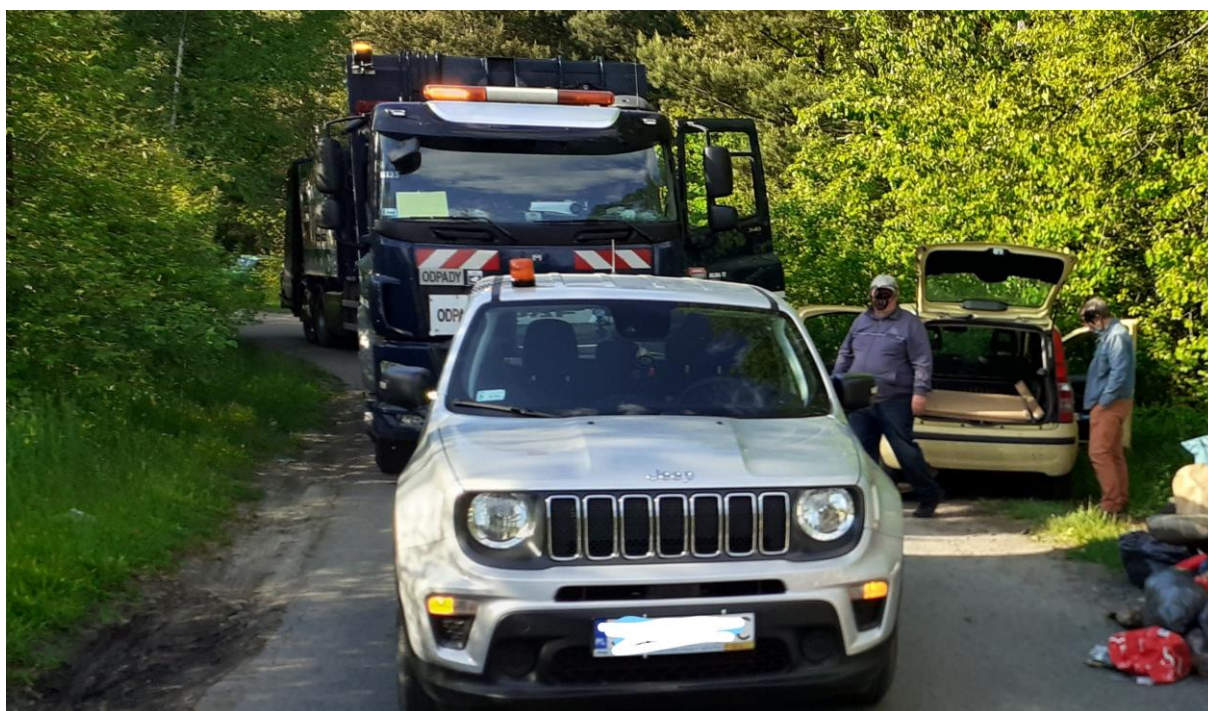
Rysunek 9. Ujęcie przez pracowników UM i ALBA MPGK na gorącym uczynku osób nielegalnie deponujących odpady

W ramach prowadzonych działań prewencyjnych w 2020 roku i I połowie 2021 roku udało się ujawnić kilkanaście przypadków podrzucania odpadów na tereny miejskie, w których to przypadkach ustalono sprawców zdeponowania odpadów, a dwa razy złapano zaśmiecających na gorącym uczynku.