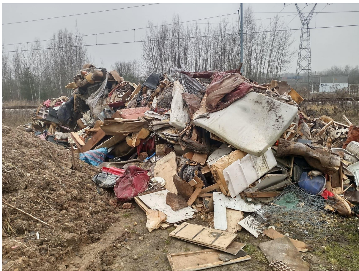
Rysunek 7. Nielegalne wysypisko odpadów w rejonie ulicy Okradzionowskiej

W 2020 roku powstały trzy duże nielegalne wysypiska odpadów. Dwa zlokalizowane na terenach należących do PKP, znajdujących się w północnej części miasta Sławkowa. Pierwsze w obrębie stacji DTA / DTB, gdzie zdeponowano kilka ton odpadów stanowiących odpady z demontażu pojazdów – pracownicy urzędu miasta ujawnili w masie zdeponowanych odpadów dokumenty mogące wskazywać na ich wytwórcę – sprawę skierowano do RDOŚ w Katowicach, jak i złożono zawiadomienie do organów ścigania. Drugie w rejonie ulicy Okradzionowskiej, w bliskiej odległości od wysypiska Rekułt, gdzie na działkach PKP zdeponowano kilka ton odpadów, stanowiących odpady wielkogabarytowe – fakt zdeponowania odpadów został zgłoszony do RDOŚ w Katowicach i Policję, które prowadzą postępowania w sprawie. Trzecie nielegalne wysypisko stanowiące odpady z demontażu pojazdów na terenach we wschodniej części Sławkowa, na działkach leśnych i inwestycyjnych – udało się doprowadzić już do usunięcia odpadów.