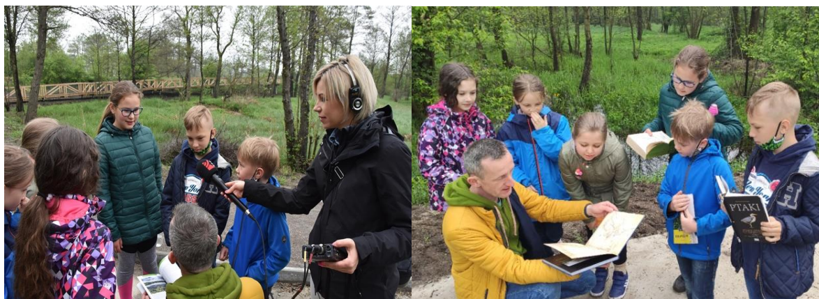
Rysunek 35. Nagrania audycji Eko-Ranek dla Radia Katowice

Tak jak i w latach poprzednich urząd miasta wspólnie z Fundacją Ekologiczną Arka zorganizował akcję ekologiczną pn. Listy dla Ziemi, która miała uwrażliwić mieszkańców na problematykę odpadów i ochronę powierzchni Ziemi.