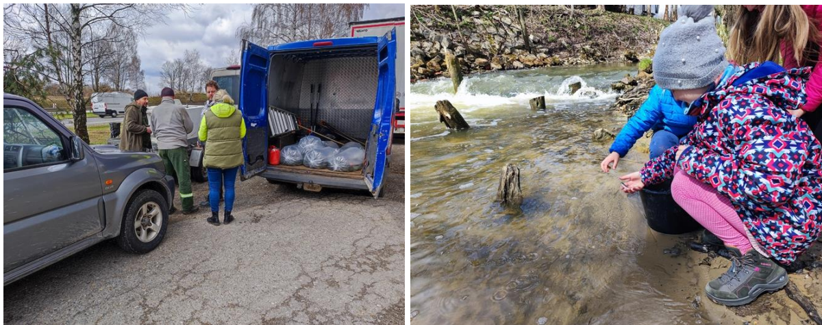
Rysunek 42. Zarybianie Białej Przemszy

W obszarze spraw związanych ze zwierzętami urząd miasta prowadził i wspierał także działania takie jak: