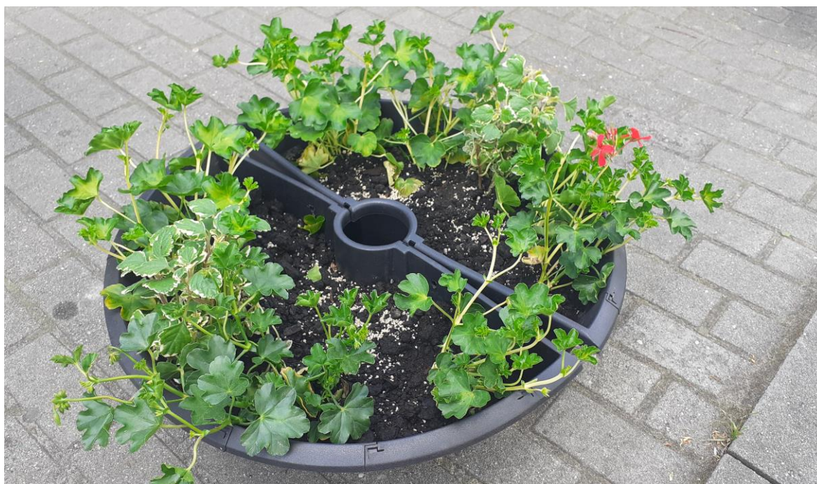
Rysunek 26. Przygotowanie kwiatów do donic ozdabiających latarnie w Rynku