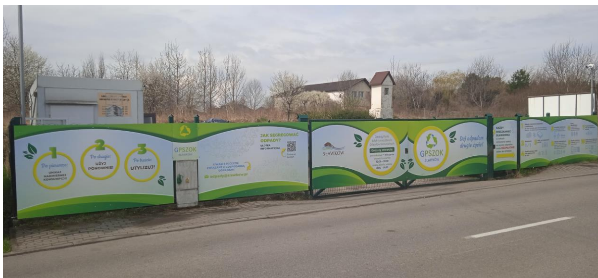
Rysunek 4. Gminny Punkt Selektywnej Zbiórki Odpadów – poprawa estetyki miejsca

W Gminnym Punkcie Selektywnej Zbiórki Odpadów Komunalnych zamontowano kamery z ciągłą rejestracją obrazu i możliwością bieżącego podglądu na teren GPSZOK. Okazało się to dobrym rozwiązaniem problemu podrzucania oraz kradzieży odpadów poza dniami i godzinami otwarcia GPSZOK. Jest to problem, z którym trudno sobie skutecznie poradzić, ale dzięki wspomnianemu monitoringowi oraz wzmożonym działaniom służb miejskich udało się skutecznie zakończyć część spraw związanych choćby z nielegalnym podrzucaniem odpadów na teren GPSZOK.