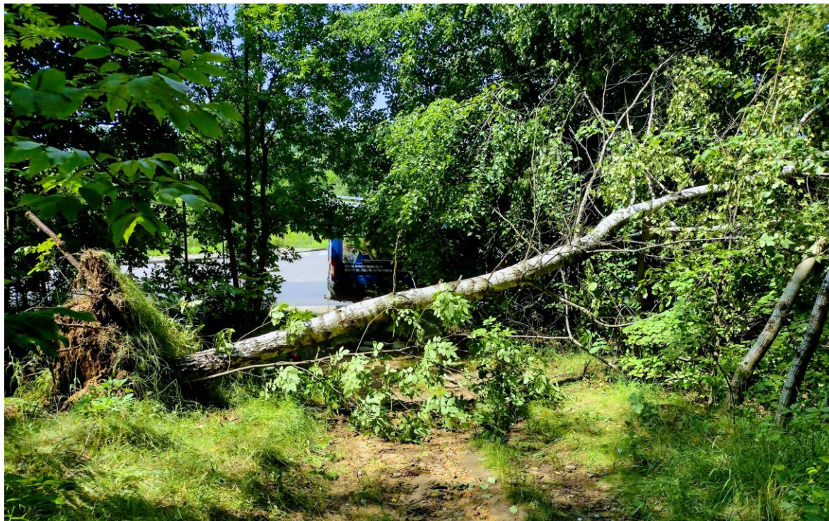
Rysunek 22. Usuwanie skutków nawałnic i porywistych wiatrów