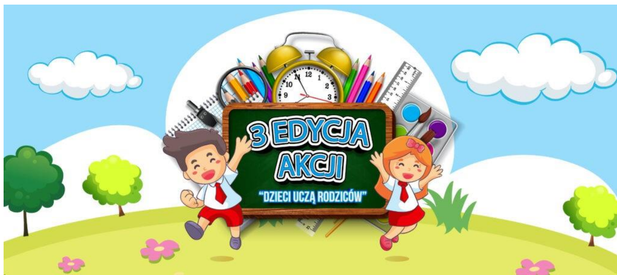
Rysunek 36. Akcja Dzieci uczą Rodziców

Urząd miasta objął patronatem także ogólnopolską akcję Dzieci uczą Rodziców. W lekcji ekologii, która za pośrednictwem platformy multimedialnej zorganizowana została przy wsparciu merytorycznym urzędu miasta wzięło udział ponad 6 tysięcy dzieci z ponad 100 przedszkoli w całej Polsce.