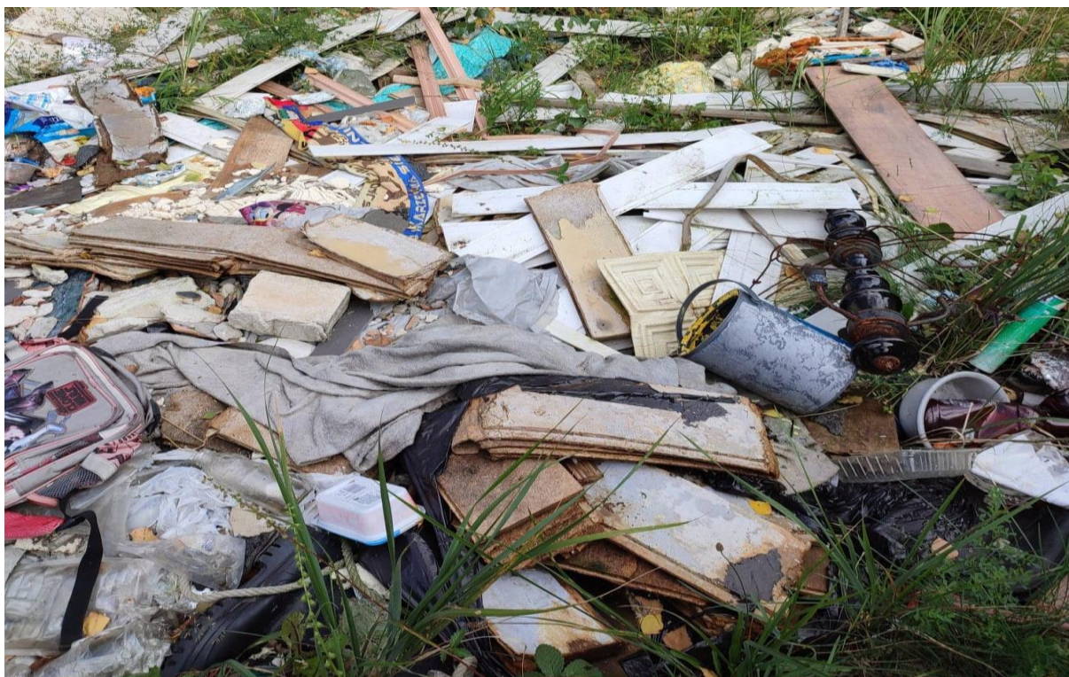
Rysunek 9. „Dziki” wysypisko odpadów w rejonie lasu na Dębowej Górze (odpady z gołębnika w postaci padłych zwierząt i odchodów)