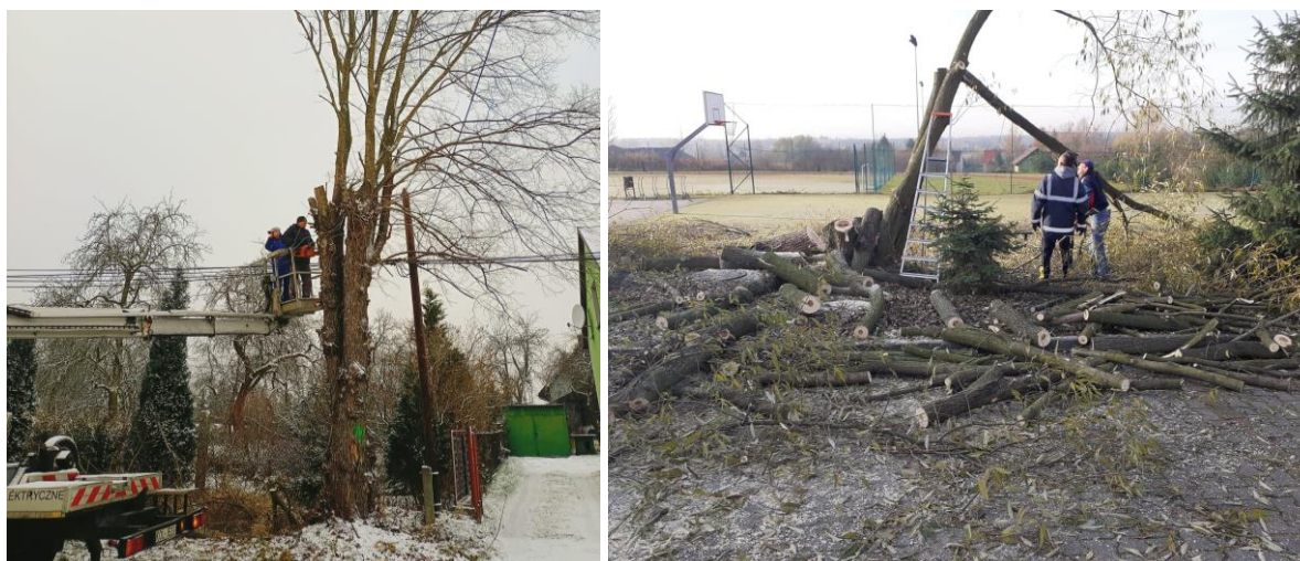
Rysunek 21. Prace pielęgnacyjne i wycinka drzew