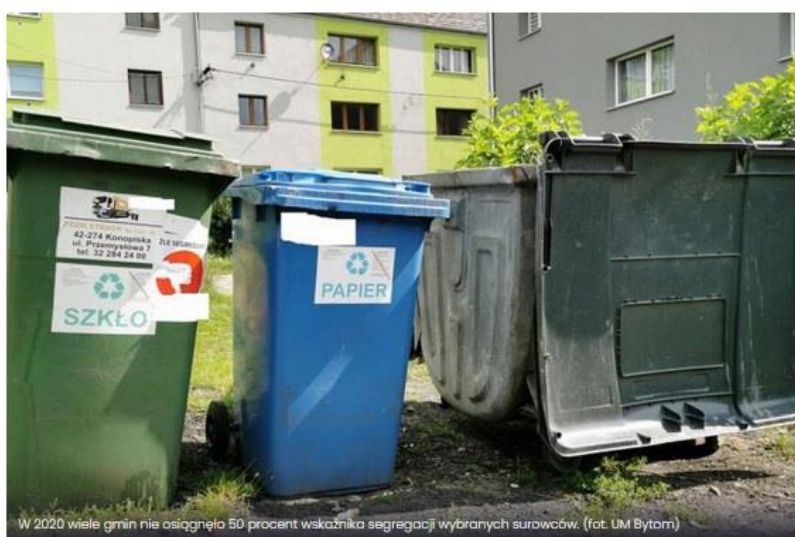
W 2020 wiele gmin nie osiągnęło 50 procent wskaźnika segregacji wybranych surowców.