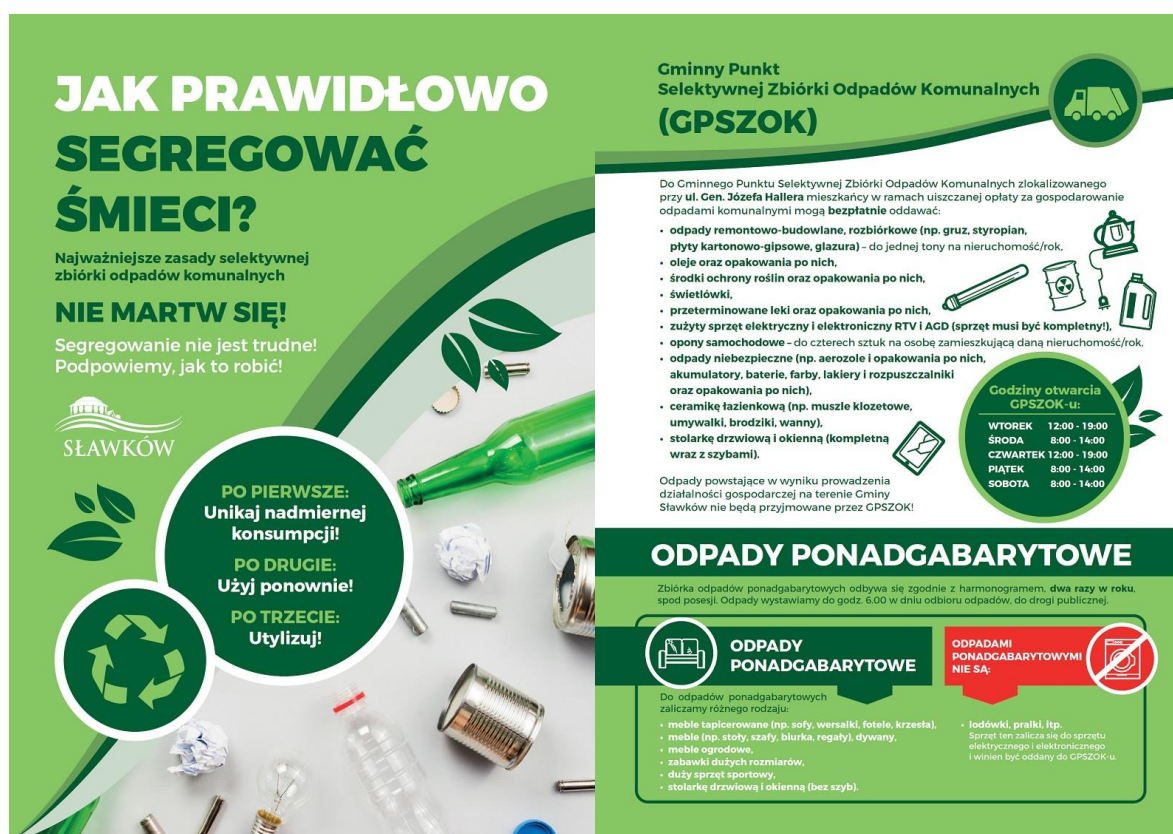
Rysunek 30. Ulotka dotycząca zasad segregacji odpadów

Stosunkowo duży nacisk w ostatnim roku położono także na edukację w zakresie przeciwdziałania zjawisku smogu i zanieczyszczeniom powietrza. W ramach kampanii jaka miała miejsce ostatniej zimy nacisk położono nie tylko na szkodliwość wynikającą ze spalania odpadów czy paliw złej jakości, ale i także na wymagania jakie przed mieszkańcami śląska postawiła uchwała antysmogowa. Oprócz artykułów i działań edukacyjnych w placówkach oświatowych staraniem referatu OSGO powstała ulotka, z której mieszkańcy mogli się coś więcej dowiedzieć na temat kar za łamanie przepisów związanych z nieprzestrzeganiem przepisów prawa w zakresie eksploatacji domowych palenisk, ale i także na temat możliwych źródeł uzyskania wsparcia finansowego na wymianę przestarzałych palenisk.