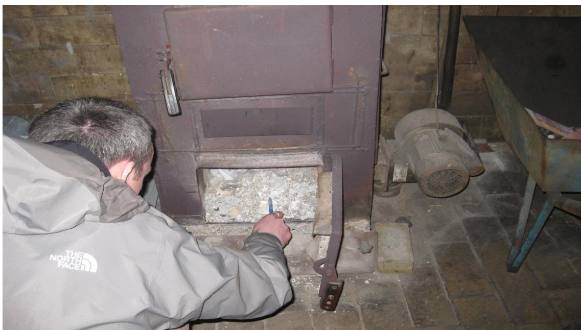
Rysunek 15. Kontrole palenisk

W ramach czynności kontrolnych związanych z kontrolą palenisk jednym z głównych zadań było sprawdzenie, czy w kotłach centralnego ogrzewania lub innych źródłach takich jak, np. piece kaflowe, kominki, itd. nie są spalane odpady lub niedozwolone paliwa. Ponieważ uchwała antysmogowa nakazywała wymienić do końca 2021r. wszystkie źródła ogrzewania, które nie posiadały tabliczki znamionowej lub były eksploatowane powyżej 10 lat od daty ich produkcji, kontrole miały na celu pouczenie właścicieli nieruchomości, którzy jeszcze takich źródeł nie wymienili, o konsekwencjach jakie ich czekają od 1 stycznia 2022r. Wymiana takich źródeł ogrzewania na ekologiczne - spełniające normy min. 5 klasy lub Ekoprojektu, z pewnością przyczyni się do ukrócenia procederu spalania odpadów, co jest po prostu niemożliwe w wymienionych wyżej nowoczesnych źródłach ogrzewania.