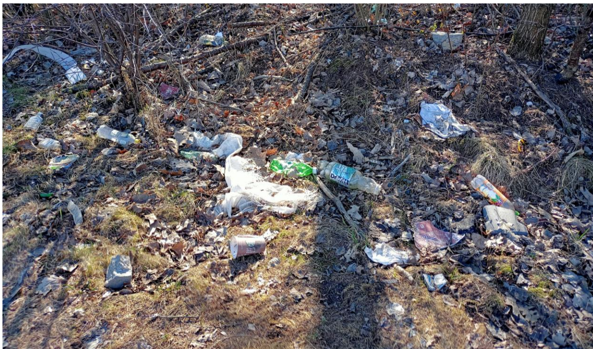
Rysunek 11. Odpady wyrzucane przez kierowców w rejonie ul. Strzemieszyckiej