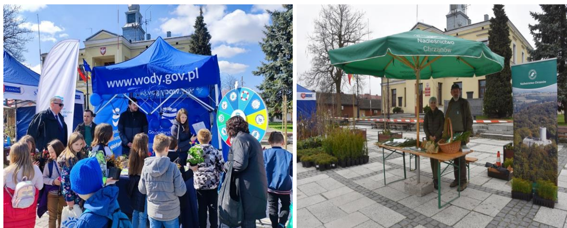
Rysunek 28. Dni Ziemi 2022 – stoiska promocyjne na Rynku

Jedną z najważniejszych już od lat akcji edukacyjnych w Sławkowie są obchody Światowego Dnia Ziemi. Akcja ta każdego roku ma bardzo szeroki zakres oddziaływania, bowiem włącza się w nią na ogół ponad tysiąc osób. Przez dwa dni, 22 i 23 kwietnia 2022 r. dzieci z Miejskiego Przedszkola, dzieci i młodzież ze Szkoły Podstawowej nr 1 im. Jana Baranowskiego, Zespołu Szkół im. Jana Pawła II, Świetlicy „Michałek” oraz indywidualni mieszkańcy zebrali w ramach akcji #trashchallenge w Sławkowie kilkanaście ton odpadów. Dzięki tej akcji nie tylko zostały usunięte odpady z miejsc do tego celu nieprzeznaczonych, ale i także udało się w ramach Dnia Ziemi przekazać ponad tysiąc sadzonek drzew i krzewów, które posadzone w przydomowych ogródkach będą zwiększyły bioróżnorodność naszego miasta, wpływając tym samym na poprawę jego estetyki. Partnerami akcji były Lasy Państwowe – Nadleśnictwo Chrzanów oraz Państwowe Gospodarstwo Wodne Wody Polskie. W 2022 roku szczególny nacisk położony został na czystość lasów i dolin rzek. Akcja, dzięki wspólnej pracy, jaką było wielkie sprzątanie Sławkowa, uświadomiła jak ważne jest wspólne dbanie o miejsce, w którym żyjemy.