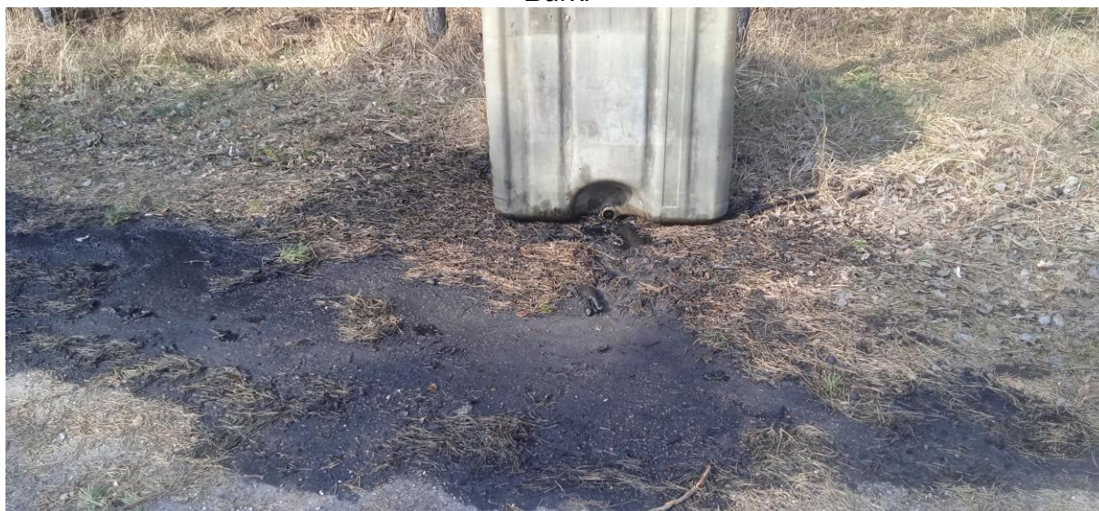
Rysunek 14. Zanieczyszczenie substancjami ropopochodnymi ziemi w rejonie ul. Burki

W 2022 roku doszło do jednego zdarzenia związanego z porzuceniem przy drodze gminnej odpadów niebezpiecznych. Odpad w postaci substancji ropopochodnej został wyrzucony w zbiorniku typu mauzer na pobocze ulicy Burki, gdzie doszło do wycieku ww. substancji do gruntu. W czynnościach oprócz pracowników urzędu brali udział także policjanci z wydziału przestępczości gospodarczej KPP, inspektorzy WIOŚ w Katowicach. Odpad o kodzie 17 05 03* (gleba i ziemia, w tym kamienie, zawierające substancje niebezpieczne np. PCB) został zebrany i przekazany do przetworzenia. Łącznie zebrano ok. 1,5 tony zanieczyszczonej ziemi.