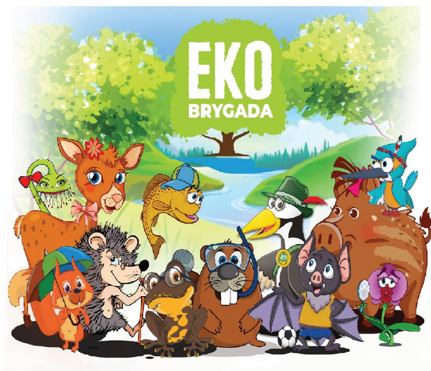
Rysunek 33. Książeczka edukacyjna z postaciami Ekobrygady

W ramach działań edukacyjnych związanych z Parkiem Doliny Białej Przemszy i Centrum Edukacji Ekologicznej stworzono dwanaście rysunkowych postaci zwierząt i roślin zamieszkujących dolinę Białej Przemszy. W sposób pobudzający wyobraźnię osób najmłodszych postacie te zaznajamiają z walorami doliny Białej Przemszy.