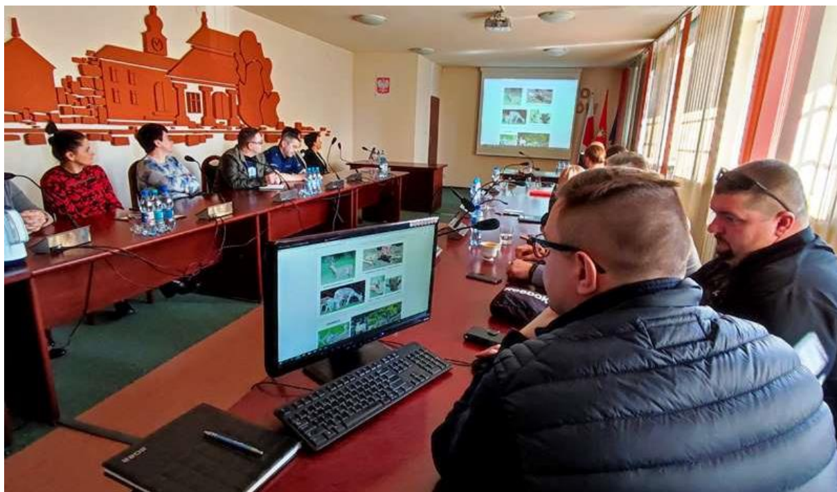
Rysunek 38. Plakat informacyjny ws. dzików