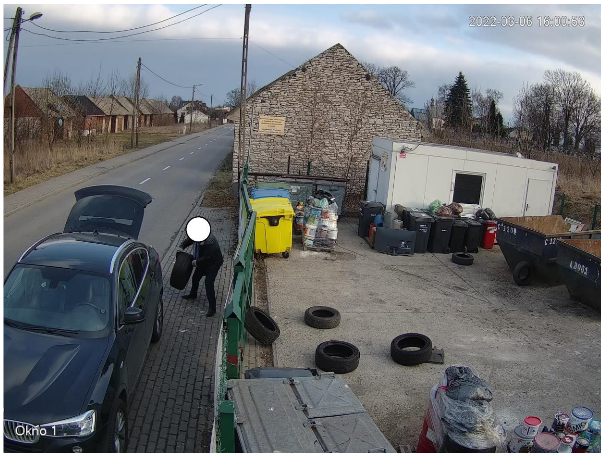
Rysunek 5. Gminny Punkt Selektywnej Zbiórki Odpadów – skuteczność monitoringu

Podobnie jak to miało miejsce w latach poprzednich Gmina Sławków finansowała mieszkańcom usługę transportu i przekazania do unieszkodliwienia odpadów niebezpiecznych zawierających azbest oznaczonych kodowo 17 06 05* - w 2021 roku z dofinansowania skorzystały 22 nieruchomości, na których zamieszkują mieszkańcy. Usunięto i przekazano do unieszkodliwienia przedmiotowe odpady na łączną kwotę 13 362,30 zł brutto . Łącznie usunięto 25,2500 Mg odpadów azbestowych.