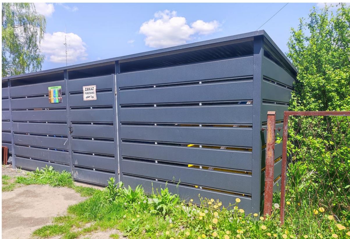
Rysunek 2. Zabudowa wielorodzinna – stanowisko gromadzenia odpadów poszczególnych frakcji na osiedlu PCK

Po pierwszym pełnym roku funkcjonowania nowego systemu gospodarki odpadami komunalnymi należy stwierdzić, że system stał się znacznie bardziej szczelny niż w latach poprzednich, a przy tym także bardziej wydajnym pod względem jakości. Na terenie nieruchomości zamieszkałych wytworzono znacznie mniej odpadów zmieszanych i zebrano więcej odpadów selektywnych, niż w roku poprzednim. Taki wynik jest bardzo dużym osiągnięciem zważając zwłaszcza na coraz bardziej wygórowane wymagania w zakresie poziomów odzysku, jak i rosnące ciągle koszty odbioru i zagospodarowania odpadów. Widać wyraźnie, że wyłączenie nieruchomości niezamieszkałych z systemu gminnego oraz likwidacja stanowisk kontenerowych, a także tworzenie przez nieruchomości wielorodzinne wspólnych, zamkniętych miejsc gromadzenia odpadów sprawiło, że wśród odpadów odbieranych są odpady rzeczywiście pochodzące od mieszkańców Sławkowa, a nie od przedsiębiorców czy mieszkańców okolicznych miejscowości (taki stan rzeczy miał miejsce przy istnieniu stanowisk kontenerowych).