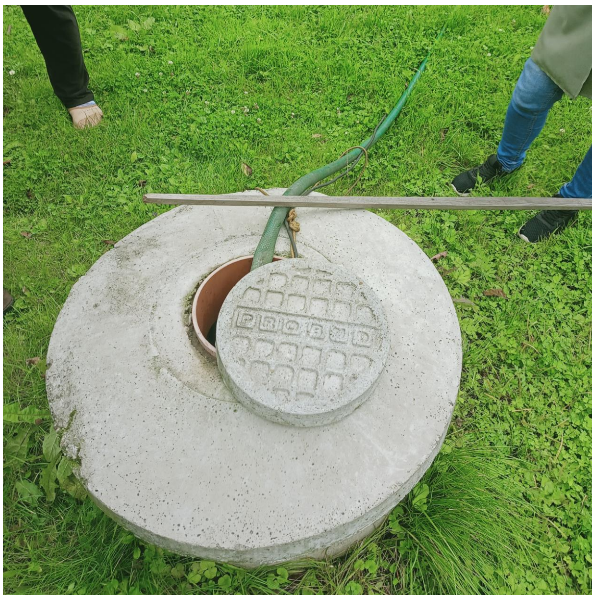
Rysunek 16. Kontrole zbiorników na nieczystości ciekłe

Istotą prowadzonych działań w zakresie pozbywania się nieczystości ciekłych była nie tylko sama kontrola wynikająca z przepisów prawnych, ale także troska o stan środowiska w naszym mieście. Podczas kontroli pracownicy urzędu biorący w nich udział, prowadzili także szeroko zakrojoną akcję edukacyjną, mającą przestrzec mieszkańców przed szkodliwymi i niebezpiecznymi dla zdrowia i środowiska skutkami wylewania ścieków. W trakcie kontroli pracownicy urzędu każdorazowo przekazywali informacje na temat możliwości pozyskania z budżetu Gminy Sławków środków przeznaczonych na realizację zadań ochrony środowiska i gospodarki wodnej –dotacji na budowę przydomowych oczyszczalni ścieków.