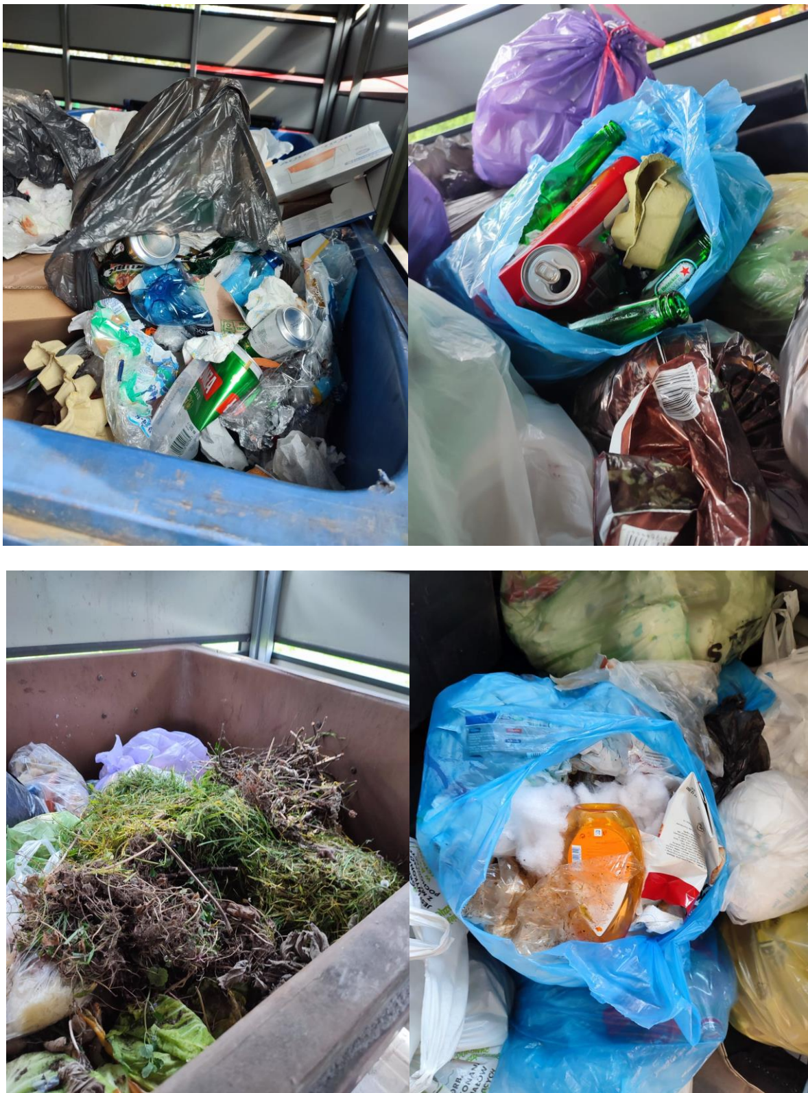
Rysunek 6. Nieprawidłowości w sposobie gromadzenia i pozbywania się odpadów – zabudowa wielorodzinna (brak segregacji)