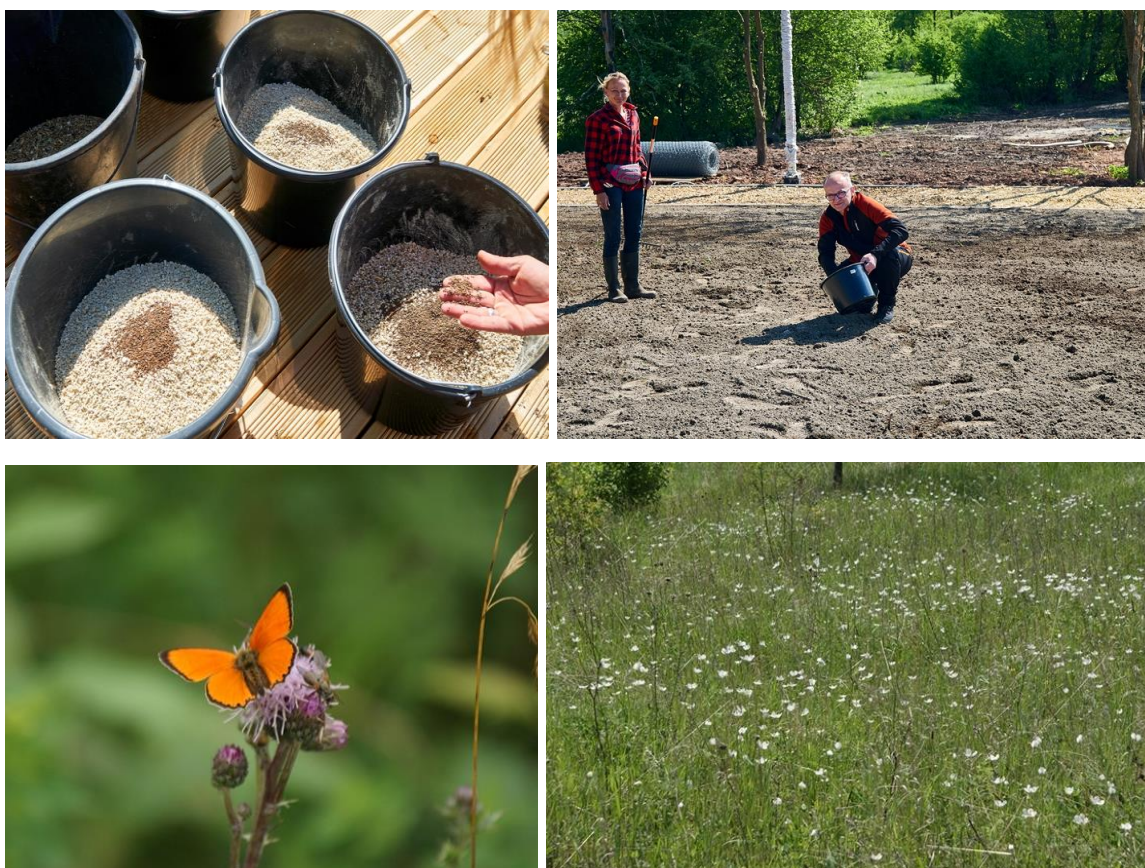
Rysunek 27. Wysiew nasion łąki kwietnej