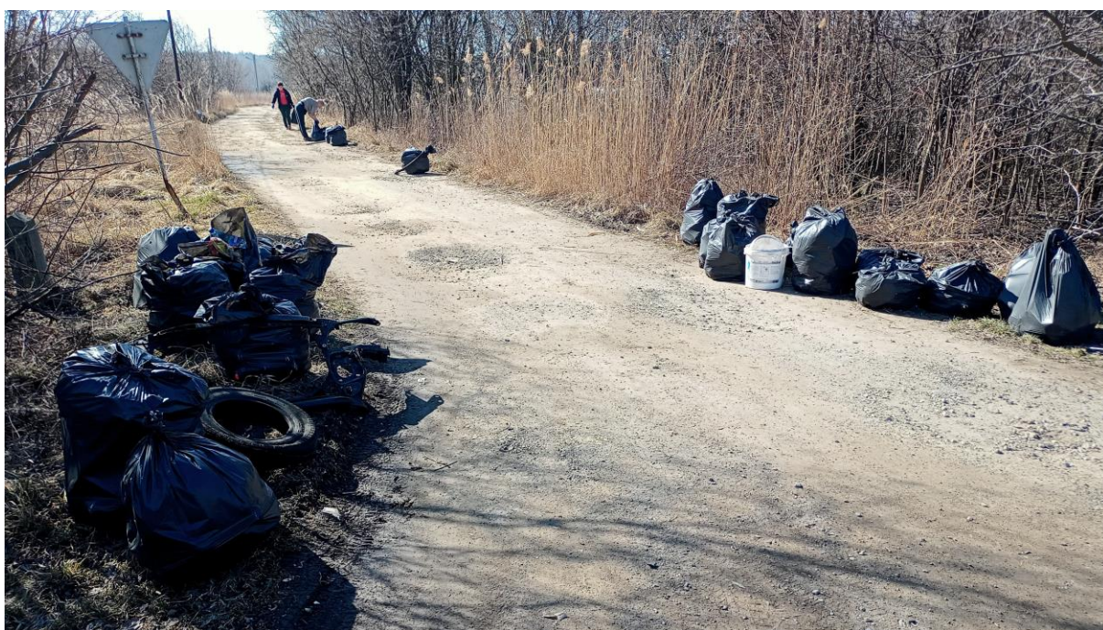
Rysunek 13. Zespół ds. zieleni i utrzymania czystości podczas prac porządkowych

Dzięki zaangażowaniu pracowników zespołu ds. zieleni i utrzymania czystości na bieżąco sprzątano problemowe miejsca, głównie wzdłuż dróg. Praca zespołu pozwalała szybko i na bieżąco reagować w poszczególnych przypadkach, a wykonywanie zadań związanych ze sprzątaniem odpadów bezpośrednio przez pracowników urzędu było o wiele bardziej ekonomicznie korzystne niż korzystanie z firm zewnętrznych.