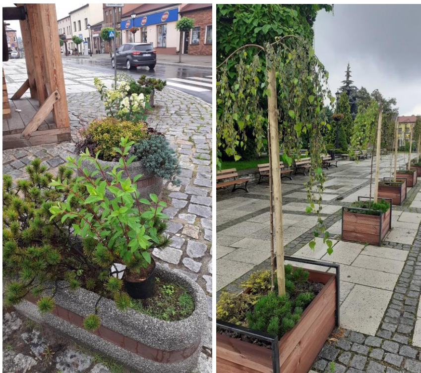
Rysunek 23. Uzupelnianie nasadzeń drzew i krzewów