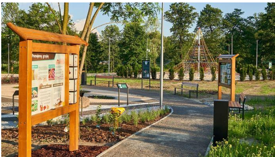
Rysunek 32. Infrastruktura edukacyjna w Parku Doliny Białej Przemszy

W ramach działań edukacyjnych związanych z Parkiem Doliny Białej Przemszy i Centrum Edukacji Ekologicznej stworzono dwanaście rysunkowych postaci zwierząt i roślin zamieszkujących dolinę Białej Przemszy. W sposób pobudzający wyobraźnię osób najmłodszych postacie te zaznajamiają z walorami doliny Białej Przemszy.