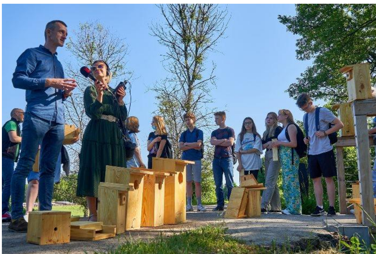
Rysunek 34. Akcja edukacyjna związana z tworzeniem siedlisk zastępczych dla zwierząt – budek lęgowych dla ptaków, nietoperzy i domków dla owadów

Oprócz powyższej audycji, w ramach działań edukacyjnych prowadzonych przez referat OSGO zrealizowano cztery audycje dla Radia Katowice w ramach cyklu Eko-Ranek. W ramach nagrań promowano walory przyrodnicze Sławkowa, a aż trzy z nagrań dotyczyły doliny Białej Przemszy i związanych z nią starorzeczy.