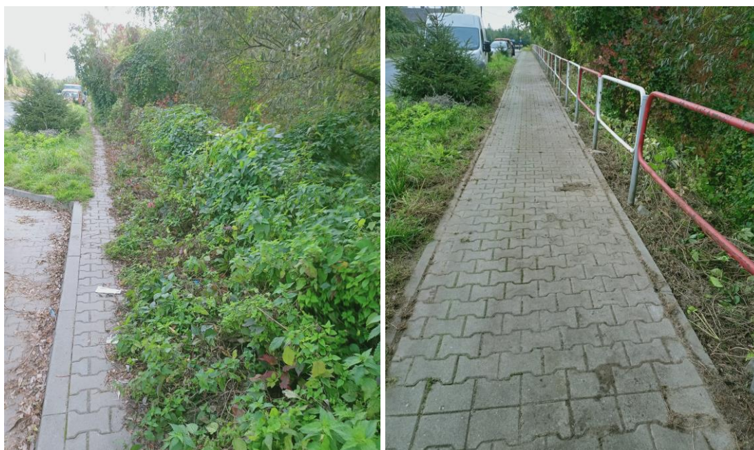
Rysunek 24. Prace w obrębie ciągów pieszych – ul. Fabryczna (przed i po)