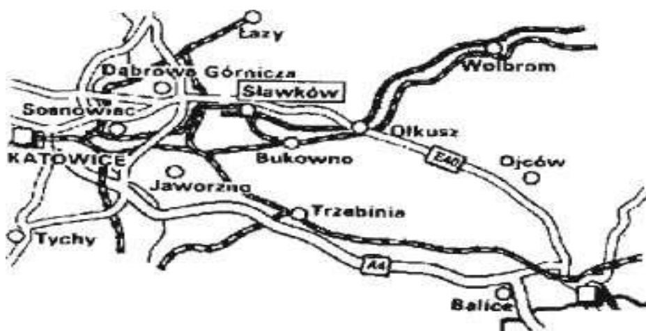
Rysunek 1. Lokalizacja Gminy

Otoczające miasto malownicze wzgórza zbudowane są z wapienno - dolomitycznych utworów triasu, z kolei w utworach permu wyróżniamy między innymi iły i gliny. Klimat Sławkowa zależy głównie od wpływu mas powietrza i jest typowy dla wyżyn środkowo - polskich.